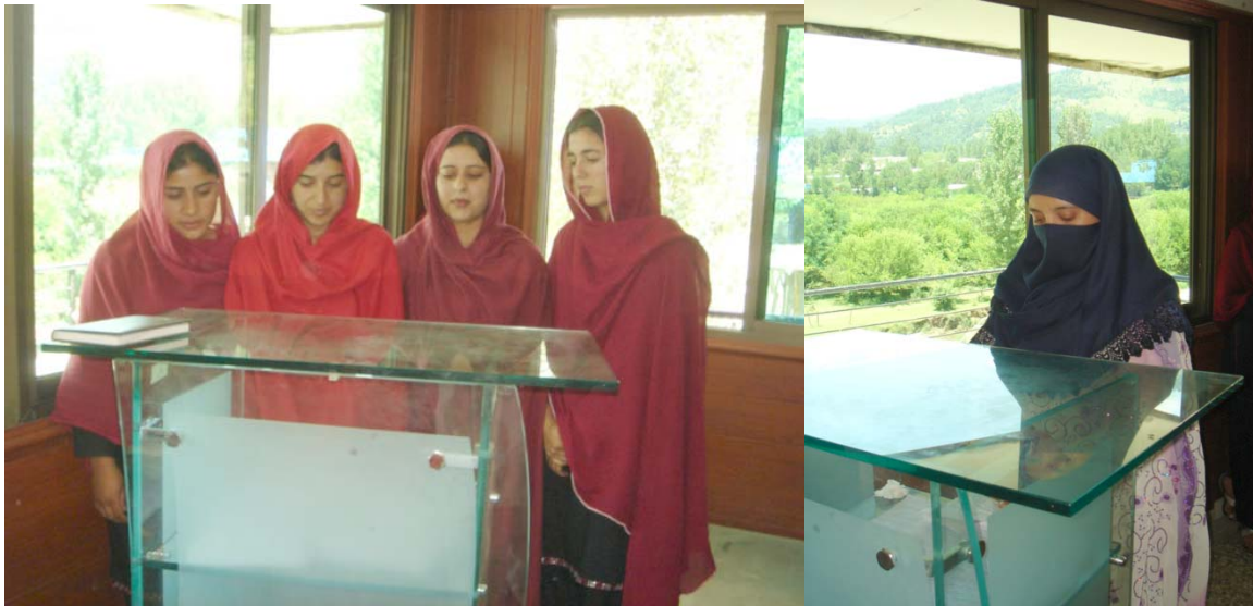
Students of vocational training centres presenting national anthem during the of Consultation on role of women to access to justice and peace

Consultation started with the recitation of Holy Quran. Learners of vocational training centres also presented national anthem.