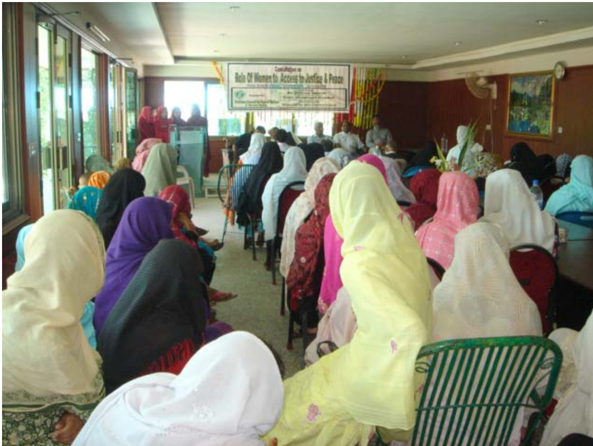
A view of Participants of One day Consultation on role of women to access to justice and peace

PCSW&HR organized one day consultation for women on Role of women to access to justice and peace at Rawalakot AJ&K on 17 th July 2009.