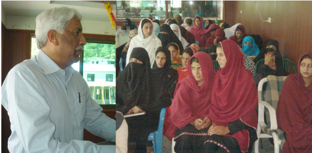
Dr. Nelson Azeem Member National Assembly addressing during the of Consultation on role of women to access to justice and peace organized by PCSW&HR

They said that women have to unite them in a groups at grass root level to eliminate the terrorism and extremism from our society, because women can play their important role to eliminate terrorism and extremism. While speaking on this occasion Mr. Muhammad Ijaz Noori said that it is a moral and social obligation of our society to strengthen the bond of love and to promote the culture of